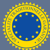
LES PRODUITS BÉNÉFICIAINT D'UNE SPÉCIALITÉ TRADITIONNELLE GARANTIE (STG)

54 produits bénéficient de la mention STG en Europe, tels que la mozzarella en Italie, le jambon Serrano en Espagne ou la moule de Bouchot en France.