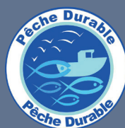
LES PRODUITS ISSUS DE LA PÊCHE MARITIME BÉNÉFICIAINT DE L'ÉCOLABEL PÊCHE DURABLE

Les produits issus d'une exploitation bénéficiant de la certification environnementale de niveau 2 entrent également dans le décompte uniquement jusqu'au 31 décembre 2029.