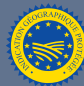
LES PRODUITS BÉNÉFICIAINT D'UNE INDICATION GÉOGRAPHIQUE (IGP)